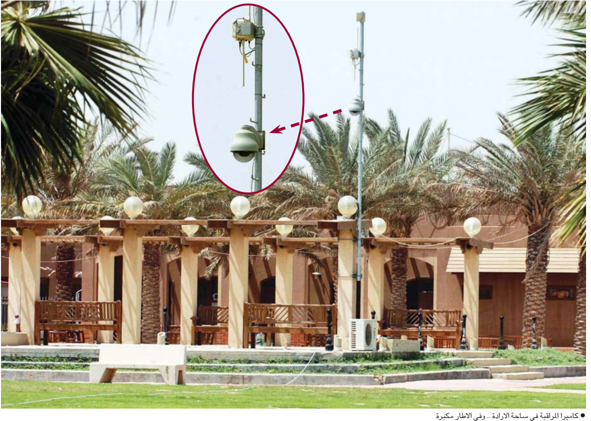
كاميرا المراقبة في ساحة الإرادة - وفي الاطار مكبرة

فوجئ المواطنون الذين يرتادون ساحة الإرادة أمام مجلس الأمة على شاطئ الخليج العربي، ان وزارة الداخلية نصبت كاميرا مراقبة على منحة الساحة التي يستخدمها المواطنون أثناء تجمعاتهم الشعبية. وسالت «القبس» أحد الفنيين عن الخطوة المستعجلة، فأوضح أن هذه الكاميرا تنقل مباشرة ما يجري في الساحة من تجمعات (صورة وصوت) وأن الكاميرا ذات أربعة أبعاد، ويمكن التحكم في عدستها لتصوير التجمعات في ساحة والإشارة بوضوح وجوههم والاصواتهم. كما سالت «القبس» صدرا الداخلية بصور التجمعات مخالفة قانونية صريحة، خصوصاً ان تصوير التجمعات يتم دون علمهم، مما يعني انتهاكاً صريحاً لحقوقهم، لأن ساحة الإرادة ليست من المنشآت الحساسة أو الأماكن المحظورة التي يفترض مراقبتها على مدار ٢٤ ساعة، بل انها ساحة عامة مسموح فيها تجمع المواطنين. وقالت مصادر برلمانية ان عددا من النواب سيجهون اسئلة إلى وزير الداخلية الشيخ جابر الخالد لمعرفة الاسباب التي دفعت الوزارة لتثبيت كاميرا مراقبة: